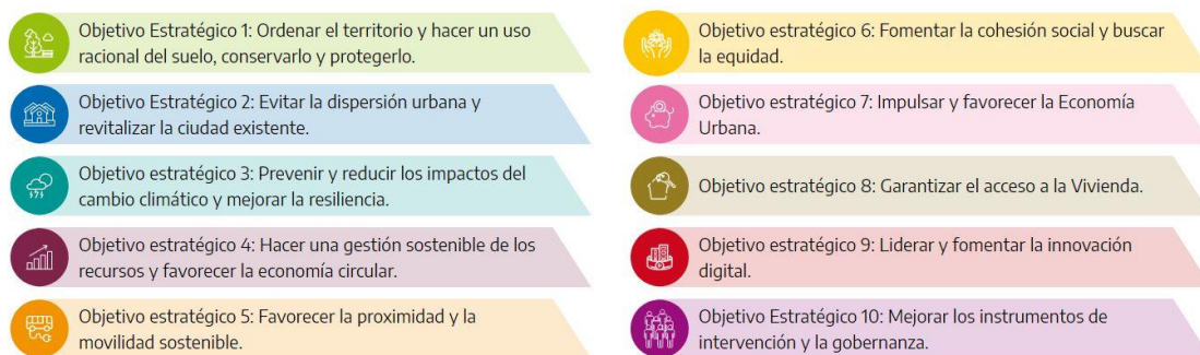
10 Objectius Generals de l'Agenda Urbana Espanyola.

També a nivell estatal cal assenyalar alguns dels mecanismes que possibilitaran el finançament d'actuacions vinculades a les Agendes Urbanes. Entre ells, el futur Pla Estatal d'Habitatge, orientat tant a la millora de la qualitat edificatòria com a l'adaptació a les necessitats socials, suposarà un instrument clau les polítiques d'habitatge. D'altra banda, els diversos programes d'ajudes i finançament de l'Institut per a la Diversificació i Estalvi de l'Energia (IDAE), s'orientaran cap a qüestions també relacionades amb l'eficiència energètica edificatòria, la mobilitat sostenible i les energies netes.